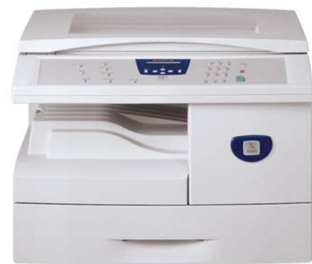
WorkCentre M15 com tampa do vidro de originais

O WorkCentre M15i oferece funções avançadas, como impressão em frente e verso, digitalizar uma vez/imprimir várias, alceamento eletrônico, digitalização em cores, fax protegido e impressão em rede — apenas para mencionar algumas delas, que geralmente só são encontradas em sistemas de escritórios de grande porte.