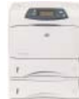
HP LaserJet 4250dtm