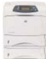
HP LaserJet 4250tn