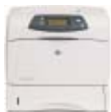
HP LaserJet 4250n