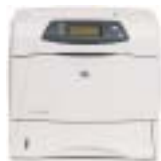
HP LaserJet 4250